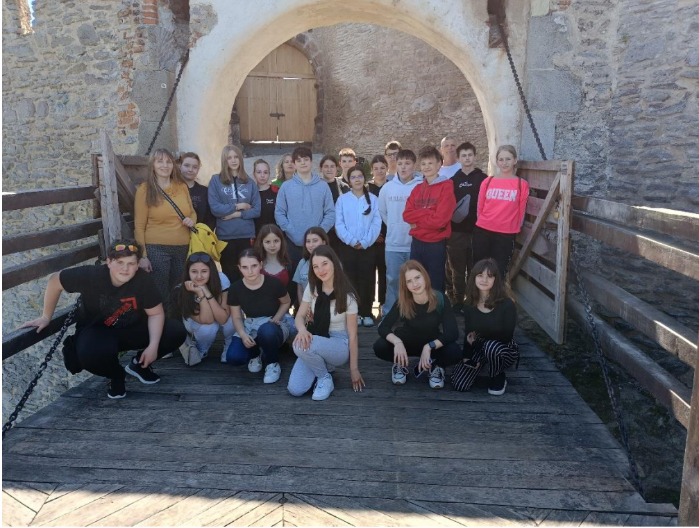
Algyógyi körtemplom, az Árpád-kori körtemplom Erdély egyik legősibb kerektemploma.